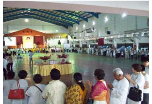
环绕会场，赞唱圣歌