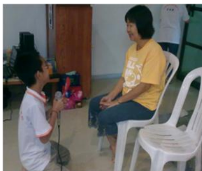
孩子敬茶及作出承诺

亚罗士打德育班在中心礼堂举办双亲节活动，表扬父母伟大的恩情，也让同学们借此佳节与双亲一起庆祝。这次活动总共有40多人参加。节目首先由学生向父母敬茶，贴心的问候及作出承诺。父母听到孩子的心声时，无不感动落泪。父母亲也送上祝福和叮咛，孩子还给父母一个拥抱，场面感人。接着的活动有猜手语和“爱的交流”环节 - 让孩子和父母亲共同发挥创意，应用有限的材料做出美术创作。