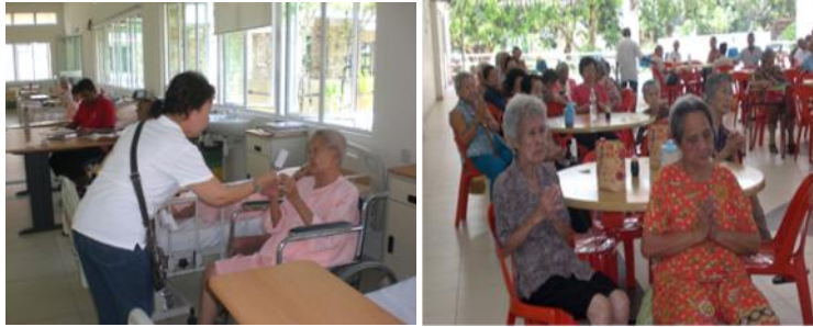
探访慰问卧病的长者