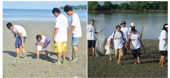
蹀入泥沼中种植树苗