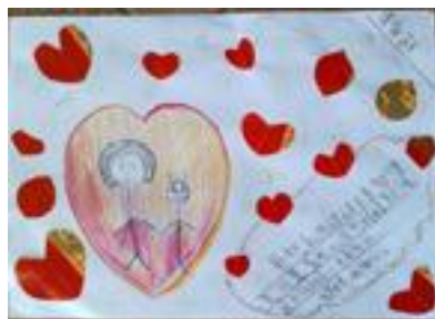
"爱的交流"的美术创作