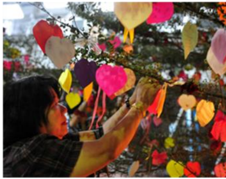
挂上心中的思念和悼词