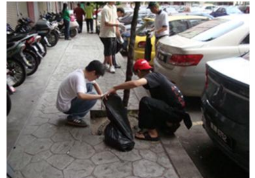
齐心协力打扫和收拾垃圾