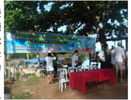
绿化运动，提高环保意识

浮罗交怡赛中心发动绿化运动，积极参与种树计划。逾100名来自吉打州的赛信徒和约50名当地居民于5月28日在浮罗交怡的甘榜瓜拉马六甲的沼泽地植树。当地的渔业协会，社区领袖和马来西亚自然学会的代表也参加。大家赤足花了两个小时栽种了1000棵红树苗。这里的海滩于2004年遭到海啸袭击，重植红树林为海洋动物提供良好的生长环境之外，另一效益是防风消浪、固岸护堤，抵御风浪袭击。这项活动顺利进行，希望能提高公众对于绿化环境和环保的意识，使大家了解保护环境人人有责。