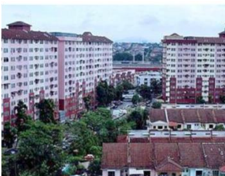
Desa Mentari 公寓外观