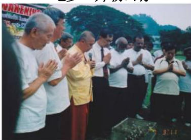
功德回向十方众生

Seenivasagam公园的终点站。在巴玛得钦多杰仁波切的带领下，大家祷告并发心将功德回向十方众生。最后举行放生和植树活动，以兹纪念。