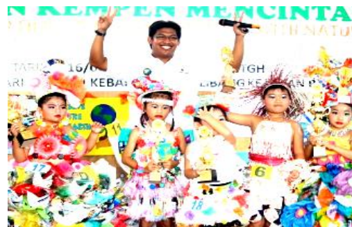
小朋友穿着用资源回收的材料缝制的服装参加表演比赛

2010年7月16日，大约300人响应浮罗交怡赛中心举办的道德价值徒步活动，从Sekolah Kebangsaan Kelibang步行到Pekan Rabu，整个行程大约是四十分钟。社团代表，学生，老师与政府官员提着环保和人类道德教育的宣传横幅和标语牌游行。希望透过各式各样，充满创意的海报，还有装饰华丽的三轮车，提醒社会人士环保和德育的重要性。节目高潮是小朋友的服装表演比赛，而服装都是用资源回收的材料缝制的。小朋友的演出获得了现场观众的热烈掌声。