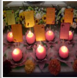
为先人点燃莲花烛

盂兰节起源於佛教传说，农历七月十四这天，目连尊者念“盂兰经”救得母亲脱离苦难。槟岛东北县赛中心于农历七月十三傍晚7时举行追悼会，纪念已故的亲友。神坛上点燃莲花烛，供奉生果、斋菜等祭品。除了唱巴赞，大家也念诵经文如吠陀、湿婆，伽耶特黎，藏传观世音真言等。当晚香火缭绕，众人一心颂经追思先人，亦温暖信徒之间的情谊。接圣火过后举行灵修讨论会，主题为“世尊对于持名的指示”，接着大家共享丰富的斋菜茶点。