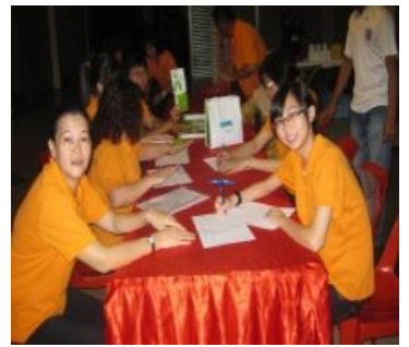
捐献器官登记运动