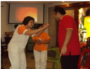
生动有趣的角色扮演

两天的课程安排了一系列的保健运动、静坐、情绪管理方法等让父母们在家学习，实践沙迪亚赛优质父母课程“修养自己，方能成就孩子”的理念。几位赛兄姐协助扮演片段，加强讲座的主轴讯息，带出父母身教及沟通的问题，希望家长更加注重妥善经营家庭关系。