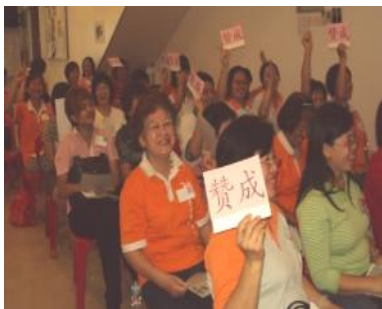
父母亲热烈参与发表意见

中文组于7月9日至10日在亚罗士打赛中心举办2010年度的第三场优质父母工作坊，共有40多位父母出席。