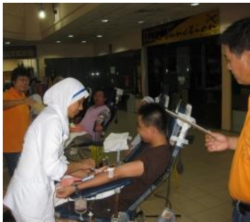
护士为捐献者抽血

2010年7月25日士姑来赛中心于八星广场（Skudai Parade）举办捐血和捐献器官登记运动。从上午9时至下午5时共有90余人登记捐血，筹得66包血液。捐血是赛信徒参与社会服务的管道之一，也是一项促进全民亲善与团结的活动。与此同时，中心也在现场展开捐献器官登记运动，提高公众人士对逝世后捐献器官遗爱人间的认同和意愿。