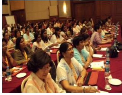
代表们全神贯注参与会议