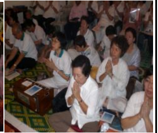
众人一心诵经追思先人