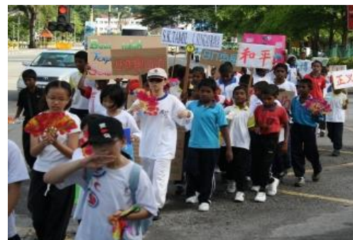
小学生举着人类道德教育的标语牌参加徒步活动